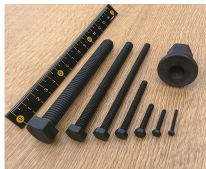
カーボンプラスチック製 軽量ボルト

レンジ事業者応援補助金」を知り、自社の強みを生かした業種転換をしたいと思います。古田化成の強みは、2018年に製品開発した「カーボンプラスチック製ボルト」で培った炭素繊維を含む複合素材成形のノウハウを保有していることです。セルロースファイバー（主成分：紙）という新しい素材に出会い、これまでとは異なった市場の製品に挑戦することに決めました。これが、主成分が紙製品「Nogakel（ノガケル）」の開発スタートとなります。