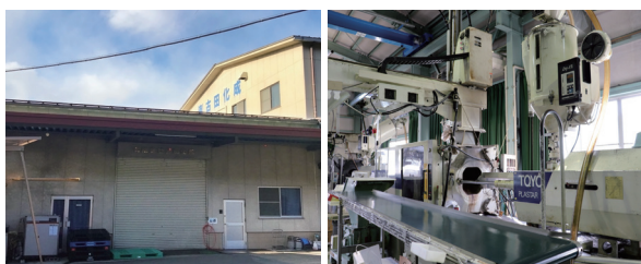
社屋（左）とプラスチック製造工場内（右）

有限会社古田化成は、岐阜県美濃市にあるプラスチック射出成形一筋、創業49年の企業です。2008年に二代目となる古田社長が事業承継しました。